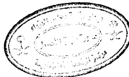
سلطان بن عبدالعزيز